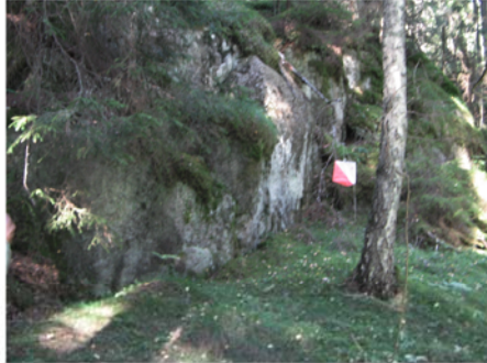
Branter finns det gott om.

Några fakta om tävlingsområdet (skogsdelen) medeltal per km 2 : (På kartan finns också några åkrar men de berörs endast marginellt.)