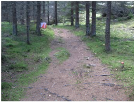
Stignätet är glest, men de som finns kan vara fina.