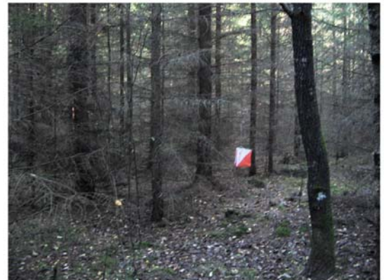
Många ljusgröna bestånd är c:a 25 år gamla och mogna för snar förstagallring.