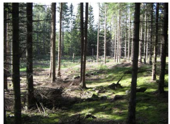
Gudrun var snäll mot oss men några stormluckor blev det.