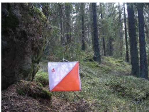
Terrängen är kuperad med höjder och dalar.