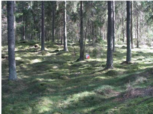
Storskogen är i regel barrblandskog på moränmark.